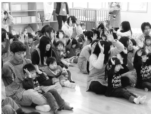
わくわく子育てカレッジ