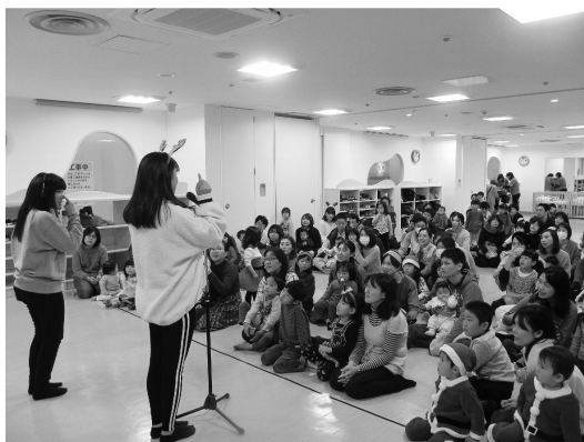
わくわく子育てカレッジ