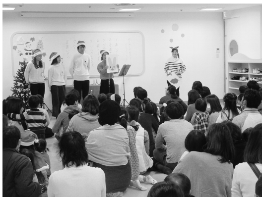
わくわく子育てカレッジ