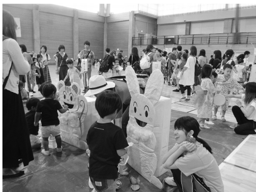
にっここサマーフェスタ

手遊びや親子ふれあい遊び、絵本の読み聞かせやパネルシアターをする。サンタさんなどのグッズを製作する。