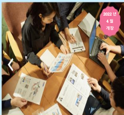
데이터 사이언스 수업의 모습

효고대학이 지향하는 「문과계 AI 인재」란, 급속적으로 진전된 디지털 사회에서 바라는 「데이터 사이언스 리터러시」를 이해하고, 분석과 설명을 할 수 있는 힘을 길러 어떤 분야에서도 활용할 수 있는 인재입니다. 그러므로 「AI·데이터 사이언스 활용 부전공」에서는 실제로 유명 IT 기업에서 활약하고 있는 스페셜리스트를 강사진으로 초대해 실천적인 수업을 실시해 갑니다.