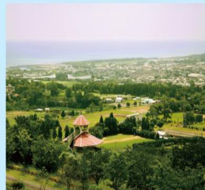
후루사토 노제(지역 납세) 사업에서 기부액 전국 2위가 된 인구 만 명의 작은 마을 데이터 전략