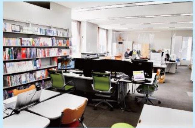
교직 · 학습지원 센터