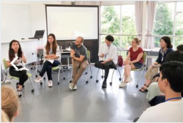
여러 나라의 학생들과 토론