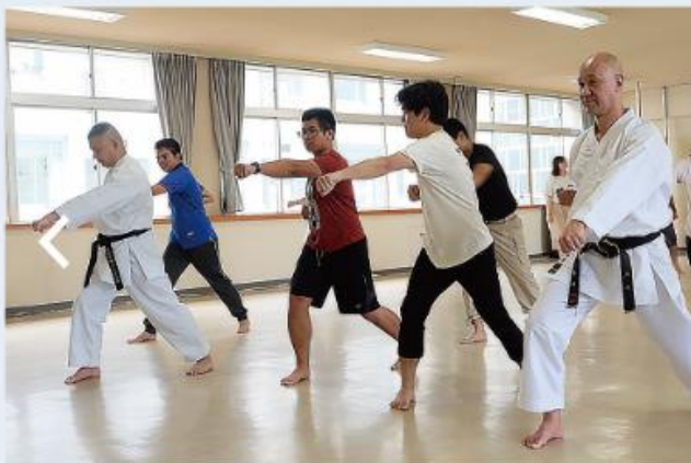
여름 캠프 문화교류(가라테)