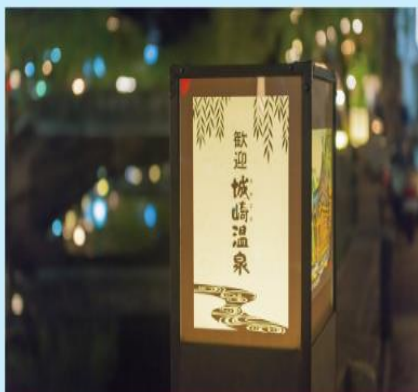
데이터 사이언스의 활용으로 관광객을 늘린 노포 온천가