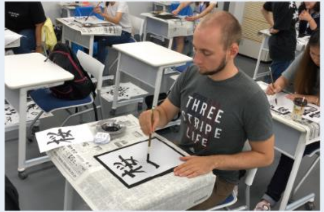
여름 캠프 문화교류(서예)